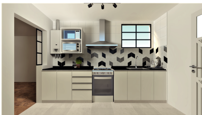
Proyecto remodelación de cocina 2022