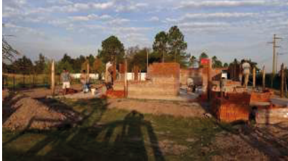
Proyecto y obra vivienda unifamiliar 2019