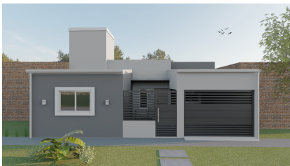
Proyecto vivienda Procrear 2022