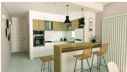
Interiorismo cocina-comedor 2022