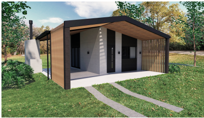
Proyecto complejo de cabañas 2022